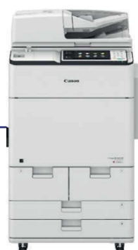
IR-ADV C7565i/ C7570i/C7580